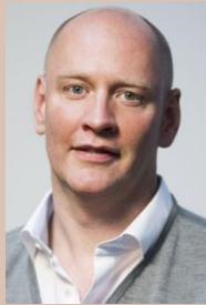
Jan Honsel Pinterest