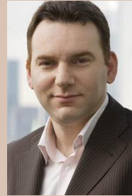
Michael Samak Burda Verlag